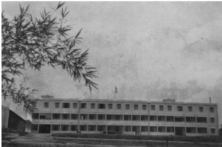
Chung viện thuở ban đầu 1959

(một số dữ liệu, nhân lễ mừng 50 năm ngày thành lập Chung viện)