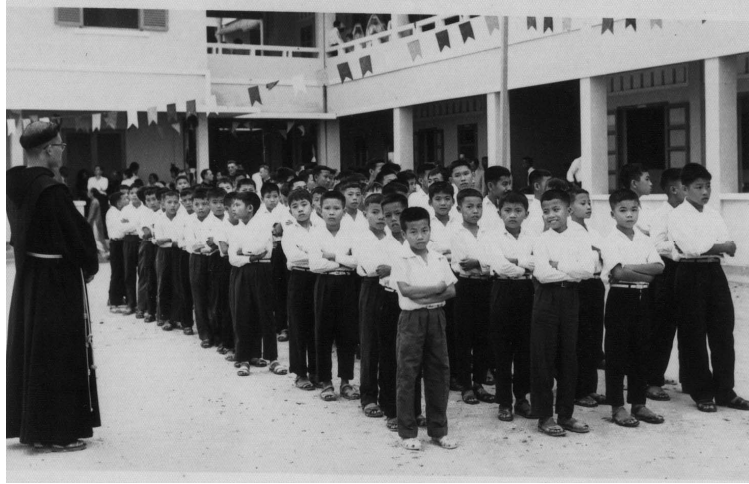
Chủng sinh trong lễ khánh thành Chủng viện 4-10-1959