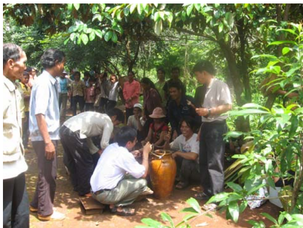
Plei Yam vui mừng có hệ thống nước lọc

Đôi dòng chia sẻ với anh em xa gần. Xin kính chúc anh em luôn mạnh khỏe, bình an. Đặc biệt cộng đoàn Pleiku xin chúc mừng bổn mạng cộng đoàn Du Sinh (15/7) và 8 anh em trong Tỉnh dòng có bổn mạng trong tháng 7. Xin chúc các anh luôn tràn đầy ơn Chúa. Amen.