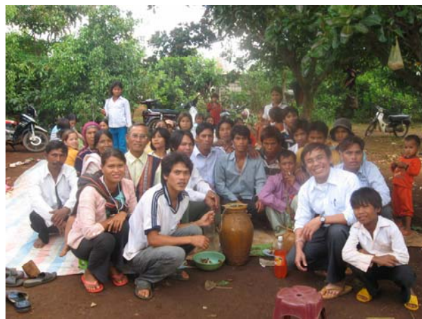
Plei Meo vừa tháp nhập Cộng đoàn